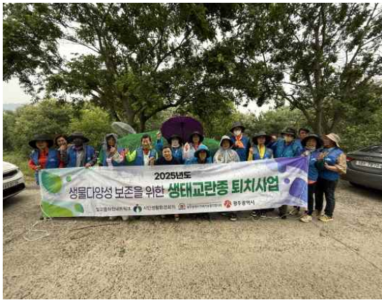
생태계 교란생물 퇴치사업