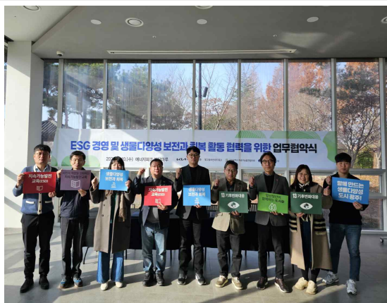
생물다양성 보전과 회복활동을 위한 업무협약식