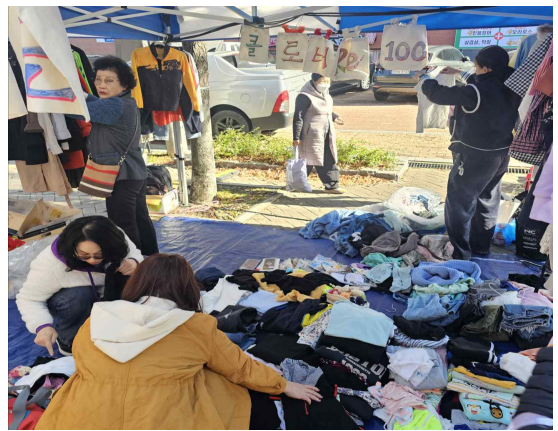
남구 기후기금 장터