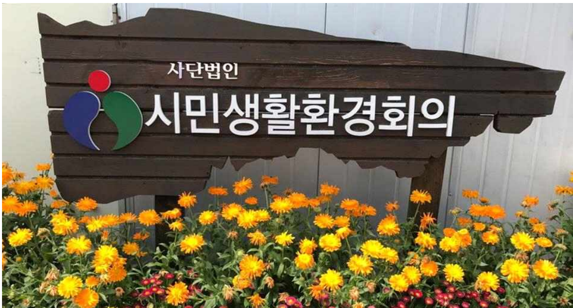
대안을 만들어가는 시민생활환경회의