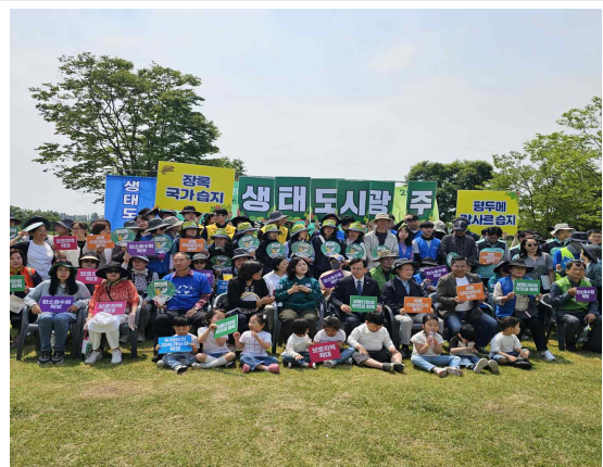
생물다양성의 날 기념행사