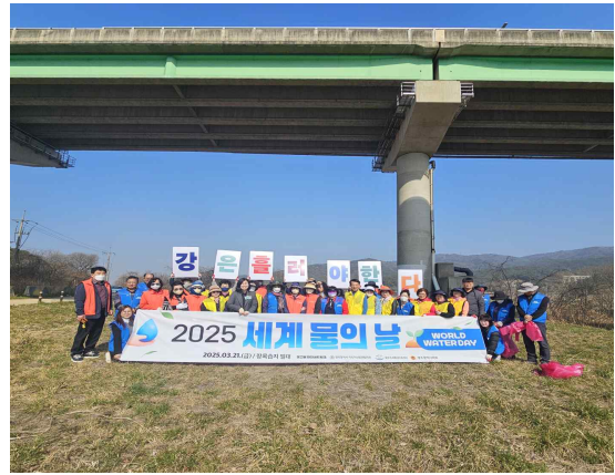
세계 물의 날