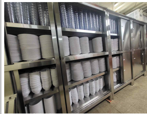
다회용기 대여사업 빌려가랑게